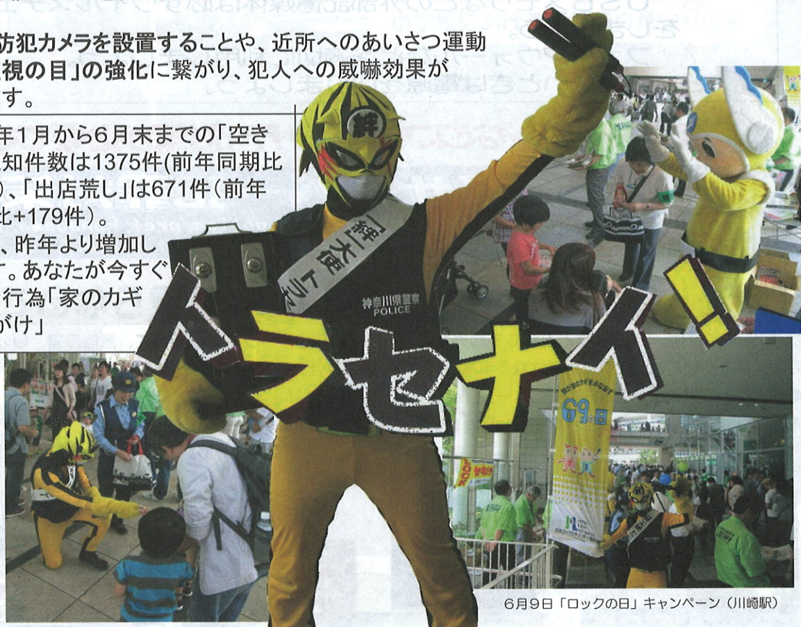
6月9日「ロックの日」キャンペーン（川崎駅）