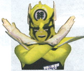
振り込め詐欺撲滅ヒーロー「絆」大使 振り込まセンジャー