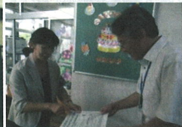
大井保育園への情報提供

◇ 学校や少年補導員と連携を図りながら、万引き防止教室などの非行防止教室やサイバー教室、街頭補導活動などを行っています。