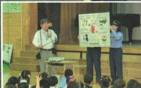
富士見台小学校における防犯教室