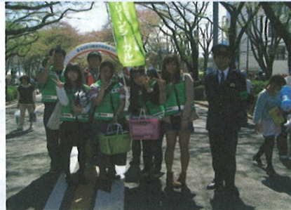
神奈川防犯シーガール隊相模原支部「グリーンシーガール」