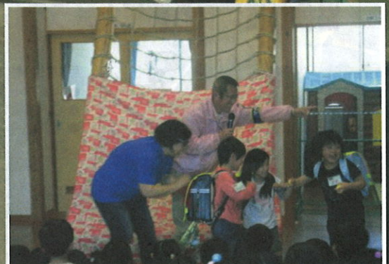
石川児童館における不審者対応訓練