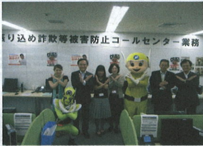
振り込め詐欺等被害防止コールセンターを激励する 黒岩県知事