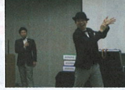
防犯エンターテインメント集団「GIFT」による「振り込め詐欺被害防止マジック」新しい手口も俺らが防ぐ！（GIFT談）

等の電話から、言葉巧みに騙され、結果的に、第三者に直接現金を手渡ししてしまう手口が増えています。